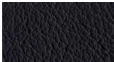
81 007 schwarz